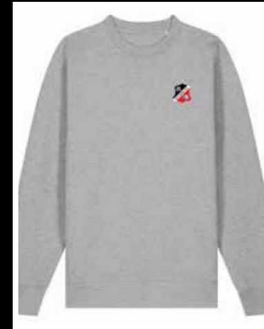
Sweatshirt Altona 93 Logo-Stick 39,93 €