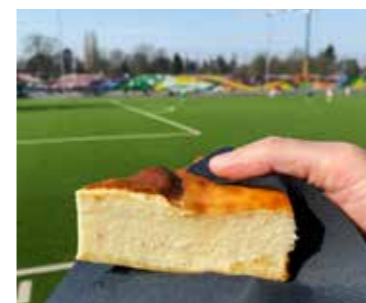
Alles Käse, aber Käsekuchen zum Trost. Gut, dass während der Spiele der U23 Pepes Cafeteria geöffnet hat. Sehr zu empfehlen ist übrigens auch der Dinkel-Apfelkuchen.

Nach der 0:4-Niederlage gegen Tesla wollte die U23 in Nienstedten zeigen, dass sie auch anders kann. 3:1 wurde nach einer couragierten und konzentrierten Leistung gegen den Tabellenneunten gewonnen. Aber nach einem guten Spiel folgt zu oft ein schlechtes, so auch gegen den Tabellenletzten Niendorf 2. Fahrlässig und behäbig wurde als Aufbauhelfer eines direkten Konkurrenten im Abstiegskampf agiert. Resultat: 1:4 verloren. Und jetzt? Morgen geht's nach Kummerfeld, jetzt Tabellenletzter, weil Niendorf in Altona gewinnen konnte. Ob es der janusköpfigen U23 gelingen wird, wieder ihr Nienstedten-Gesicht zu zeigen? Anpiff ist um 14 Uhr am Sportzentrum Kummerfeld, Ossenpad 1.