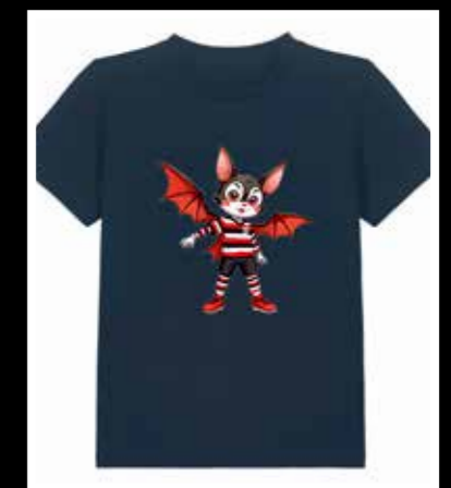
Pip T-Shirt Kids 24,90 €