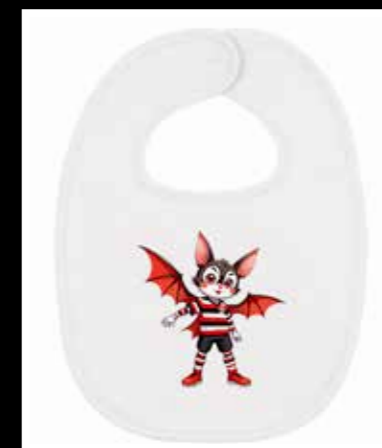
Pip Baby-Lätzchen 15,90 €