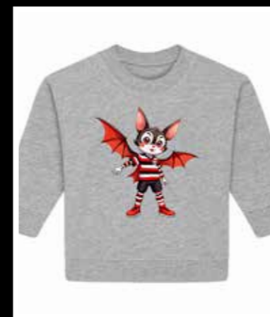
Pip Sweatshirt Baby 34,90 €