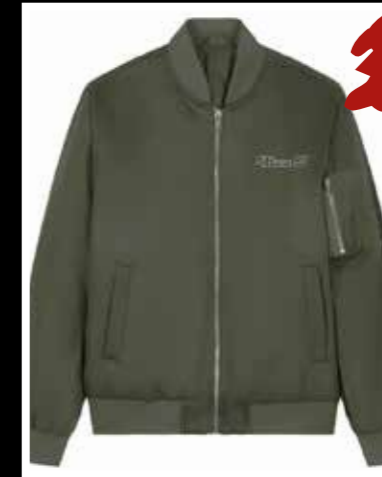
Bomberjacke grün 99,00 €