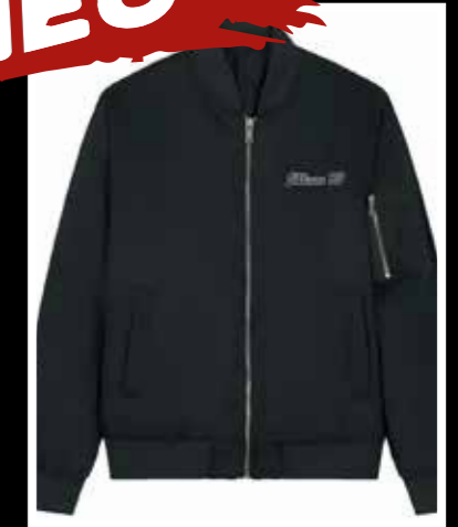
Bomberjacke schwarz 99,00 €