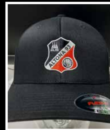
Altona 93 Flexfit Fitted Cap