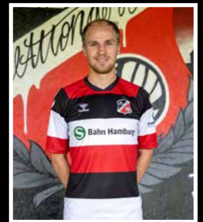
Heimtrikot Hummel 23/24