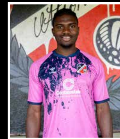
Auswärtstrikot Hummel 23/24