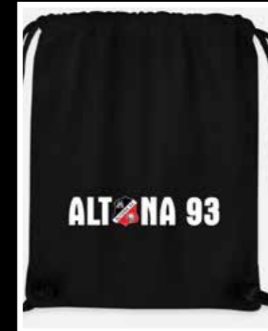
Altona 93 GymBag