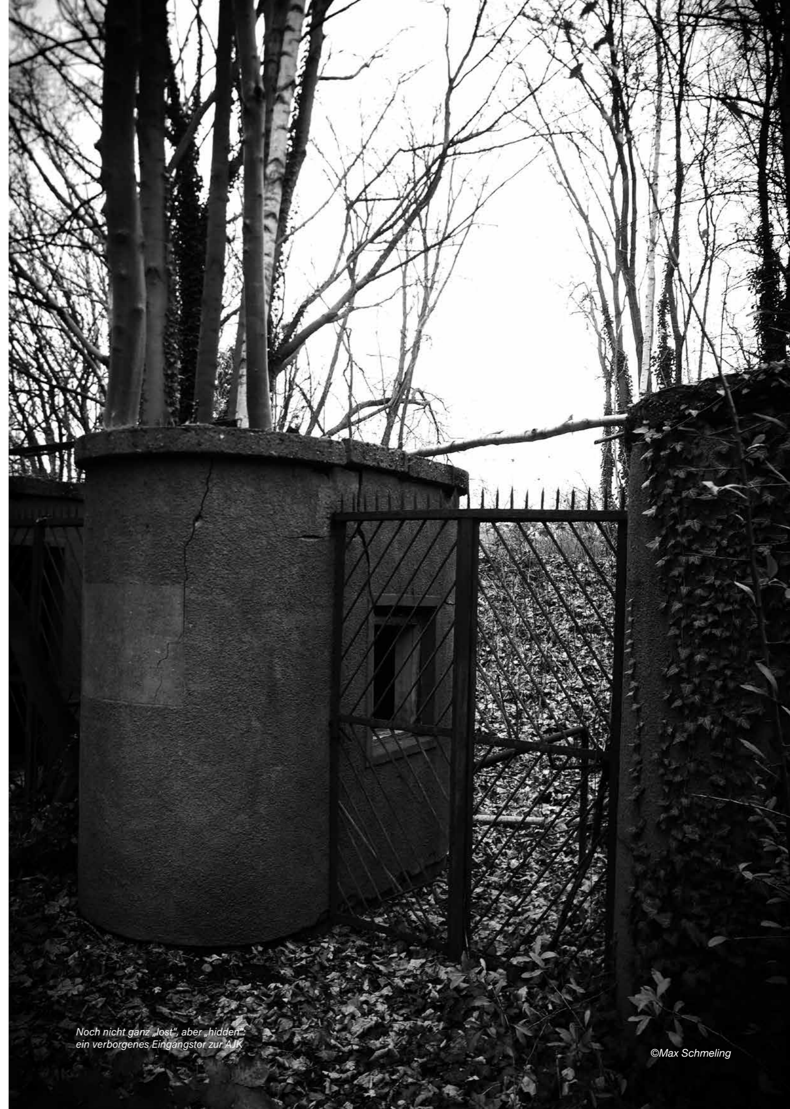
Noch nicht ganz „lost“, aber „hidden“: ein verborgenes Eingangstor zur Aik

Ganz ohne nationalen Titel blieb Altona 93 anno 1903 übrigens doch nicht. Der Mittelläufer Miklós Bradanovic wurde drei Monate nach dem Fußballfinale Deutscher Meister der Leichtathletik über 1500 und 3000 Meter. Immerhin.