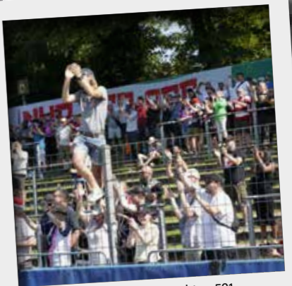
Das Stadion Hoheluft besuchten 521 Zuschauer - mehr als bei den beiden vorherigen Supercup-Spielen zusammen