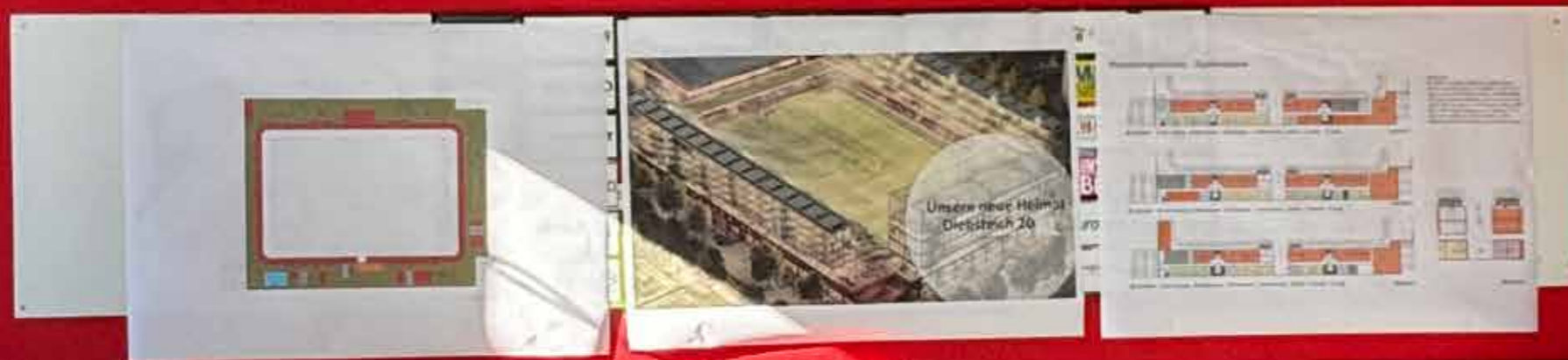
Ragnar Törber, 2. Vorsitzender des AFC, präsentiert die Stadionpläne im „Ball-saal“ an der noch bestehenden Adolf-Jäger-Kampfbahn