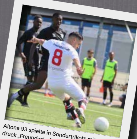
Altona 93 spielte in Sondertrikots mit Aufdruck „Freundschaft“