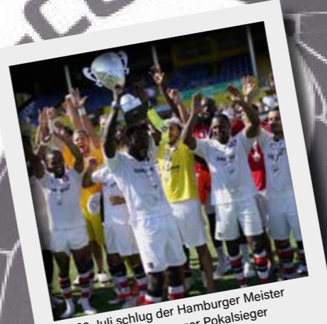
Am 20. Juli schlug der Hamburger Meister Altona 93 den Hamburger Pokalsieger Teutonia 05 mit 3:1