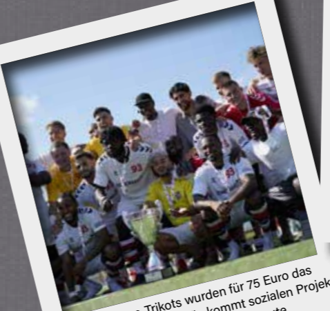
Die Supercup-Trikots wurden für 75 Euro das Stück verkauft, der Erlös kommt sozialen Projekten von „Lemonaid & ChariTea“ zugute