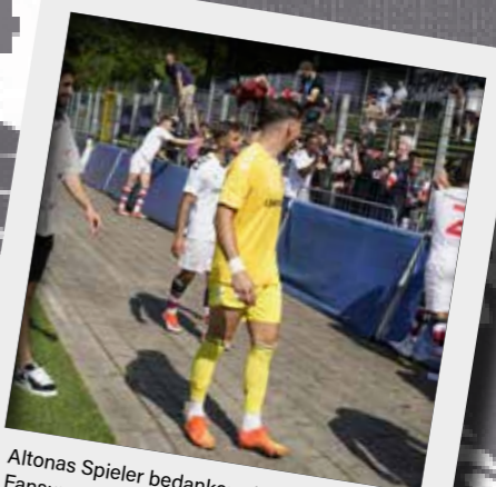
Altonas Spieler bedanken sich für den Fansupport