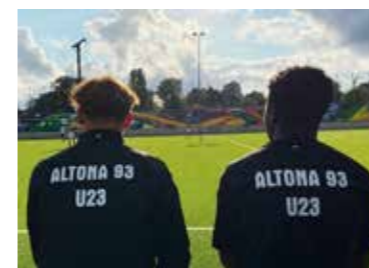
Es ist schon von hinten zu sehen, dass es sich um eine sehr junge Mannschaft handelt. Getrennte Etats gibt es übrigens nicht mehr. Erste Mannschaft und U23 werden aus demselben Topf finanziert.