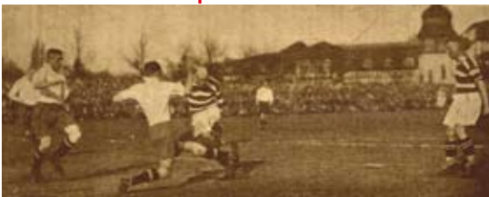
Unser „Adolf“ im Einzelkampf vor dem HSV-Tor